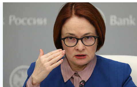
В ЦБ оценили риски банковского кризиса в США и Европе