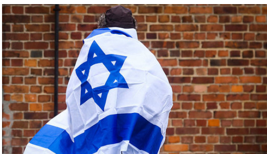
Израиль для своих